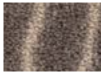
Taupe 750 4 m