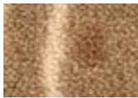
Peuplier 620 4 m