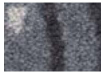
Fusain 950 4 m