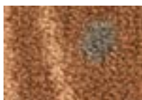
Sycamore 660 4 m