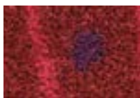
Prunus 590 4 m