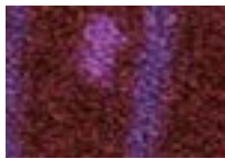
Aubépine 880 4 m